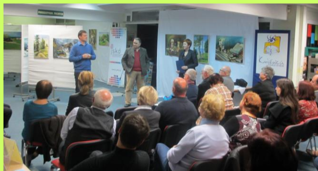
fotografija z odprtja izpred treh let

Razstava bo na ogled v času odprtosti knjižnice do 13. decembra.